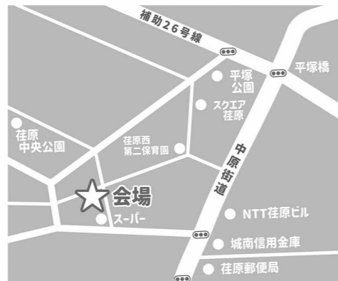
⑫品川荏原どうぶつ病院