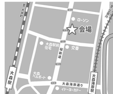
⑭ラパスペットクリニック