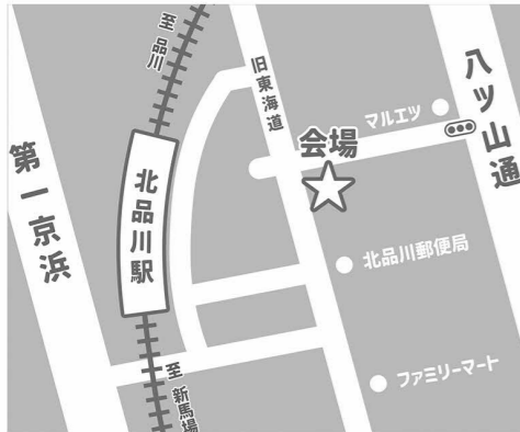
①北品川どうぶつ病院