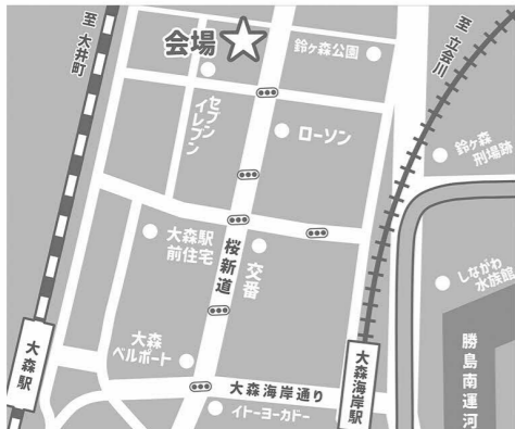
⑤たなかじろう動物病院