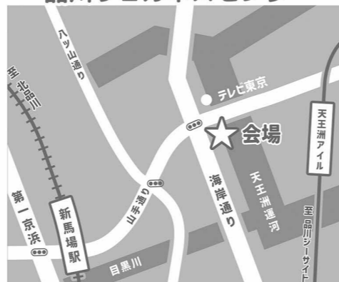
⑬ダクタリ動物病院 品川ウェルネスセンター